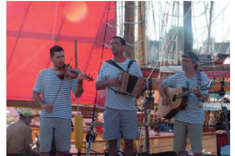
• Les bretons du groupe Anno Heb Bed