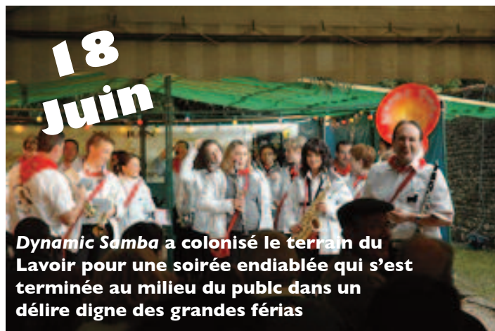
Dynamic Samba a colonisé le terrain du Lavoir pour une soirée endiablée qui s'est terminée au milieu du public dans un délire digne des grandes fêtes