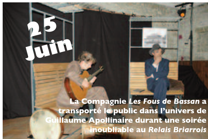
La Compagnie Les Fous de Bassan a transporté le public dans l'univers de Guillaume Apollinaire durant une soirée inoubliable au Relais Briarrois