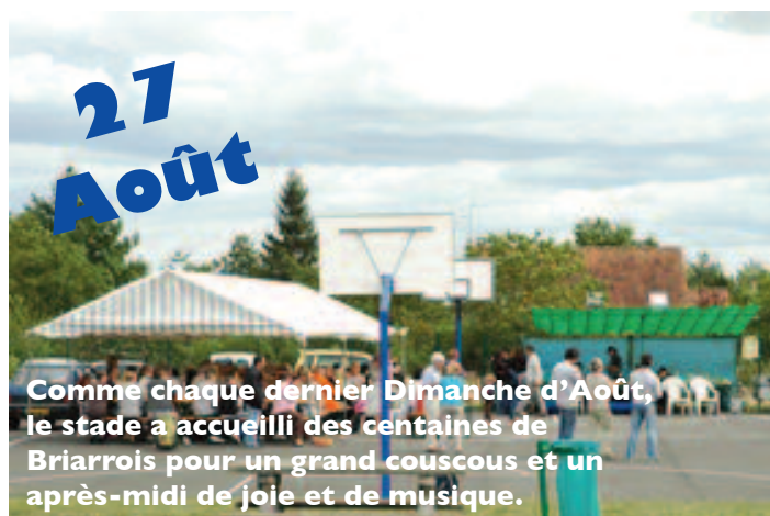
Comme chaque dernier Dimanche d'Août, le stade a accueilli des centaines de Briarrois pour un grand couscous et un après-midi de joie et de musique.