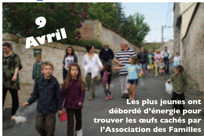
Les plus jeunes ont débordé d'énergie pour trouver les œufs cachés par l'Association des Familles