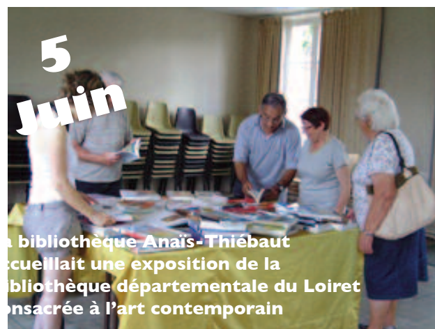
La bibliothèque Anaïs-Thiébaud accueillait une exposition de la bibliothèque départementale du Loiret consacrée à l'art contemporain