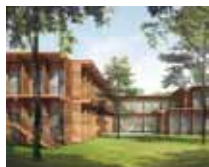
Collège WEILER HŒE à MONTGERON (91)