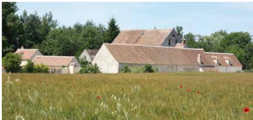
■ Le Moulin de Châtillon d'Ondreville-sur-Essonne accueille aujourd'hui de nombreuses manifestations.