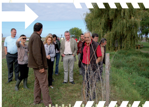
Visite des travaux financés le long de la Rimarde

Le Contrat Global Essonne amont signé avec l'A.E.S.N. en octobre 2007 est dans sa quatrième année de mise en oeuvre.