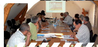
Ateliers-forum pour la coopération