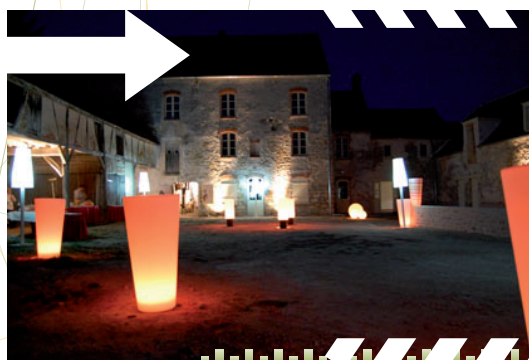
Inauguration de la soirée de restitution au Moulin de Châtillon

Le programme des animations 2011 des « Week-ends de La Route du Blé en Beauce » a connu, cette année encore, un grand succès. La mobilisation des acteurs a permis de proposer 57 manifestations aussi diverses que variées : concerts, expositions, spectacles, randonnées ... réparties sur tout le territoire du Pays.